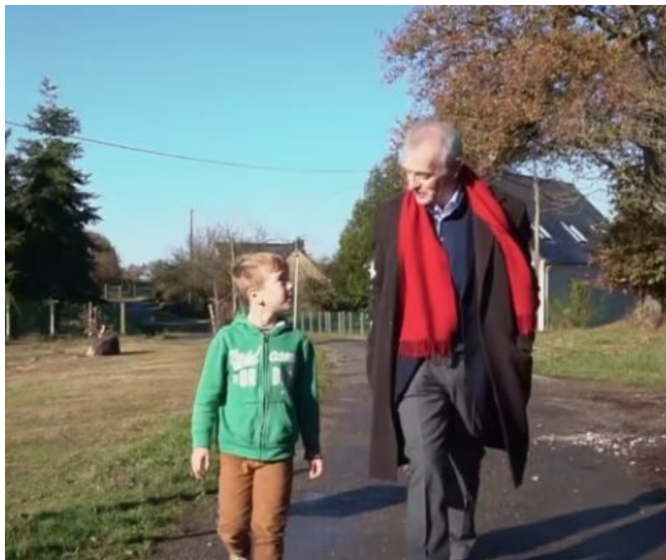
Le glaciologue Jean Jouzel expliquant la recherche et le climat à son petit-fils lors d'une promenade dans son village natal, Janzé (Bretagne)