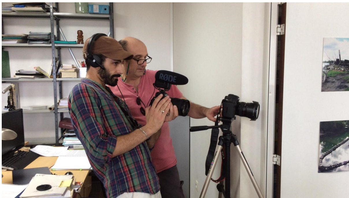
Le réalisateur et cinématographe au premier plan