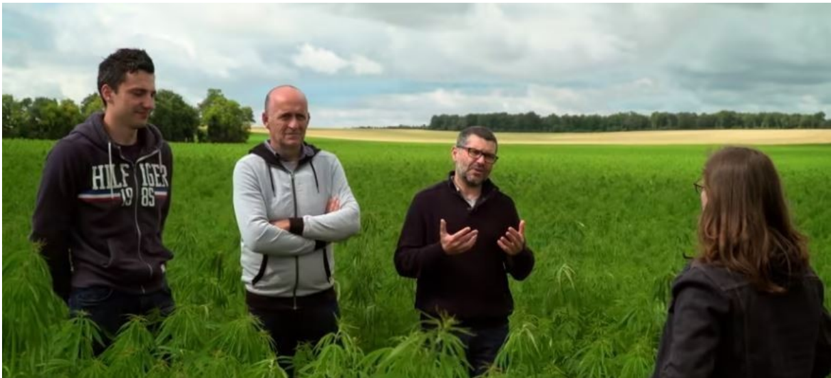
Des agriculteurs de la Beauce rêvant de décarboner la construction avec le chanvre et le bois