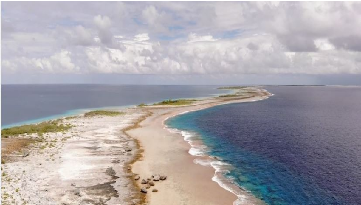
Un atoll coralien menacé