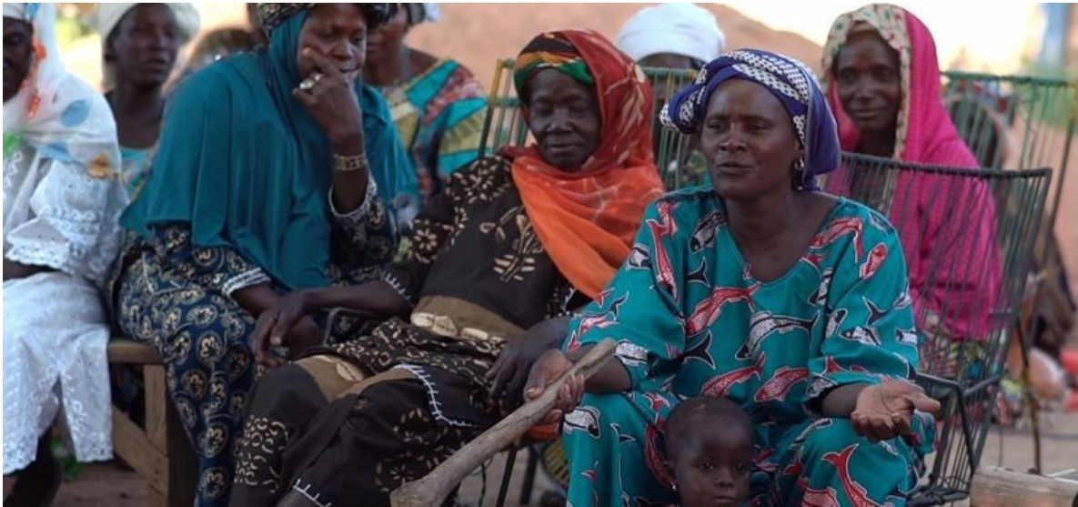
Les femmes du village sahélien de Fonsebougou au Mali